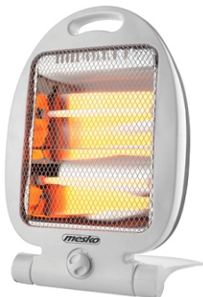
Quartz Heater MS 7710