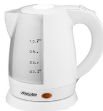
Electric Kettle MS 1276