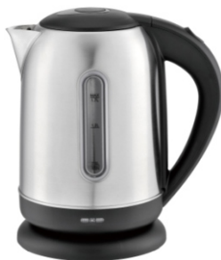
Electric Kettle MS 1288