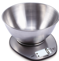
Kitchen Scale MS 3152