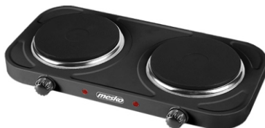
Double hot plate MS 6509