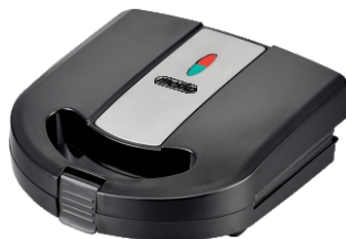
Sandwich Maker MS 3045