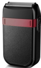
Hair Shaver AD 2932