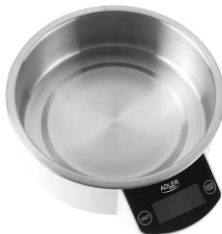
Kitchen Scale AD 8121