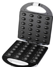
Nut Cookie Maker AD 3039