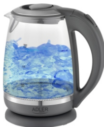
Kettle AD 1286