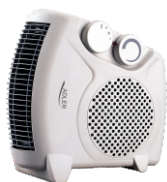
Fan Heater AD 77