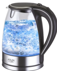
Electric kettle AD 1225