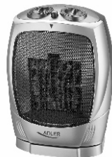
Fan Heater AD 7703