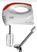
Mixer with blending shaft AD 4212