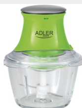
Chopper AD 4056