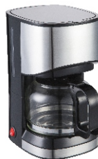
Dripp Coffe Maker AD4407