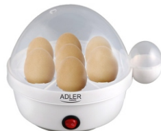
Egg Boiler AD 4459