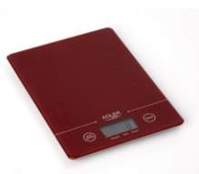
Electronic kitchen scale AD 3138