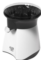
Citrus Juicer AD 4005