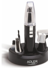
Trimmer AD 2907