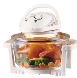
Halogen Oven AD 6304