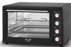
Electric Oven AD 6010