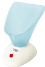
Facial sauna AD 2153