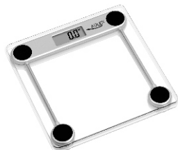
Bathroom Scale AD 8121