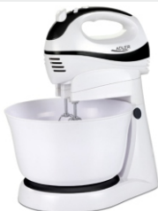
Mixer w/rotating bowl AD 4206