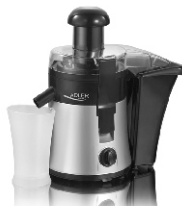
Juice Extractor AD 4106