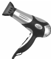
Hair Dryer AD 2224