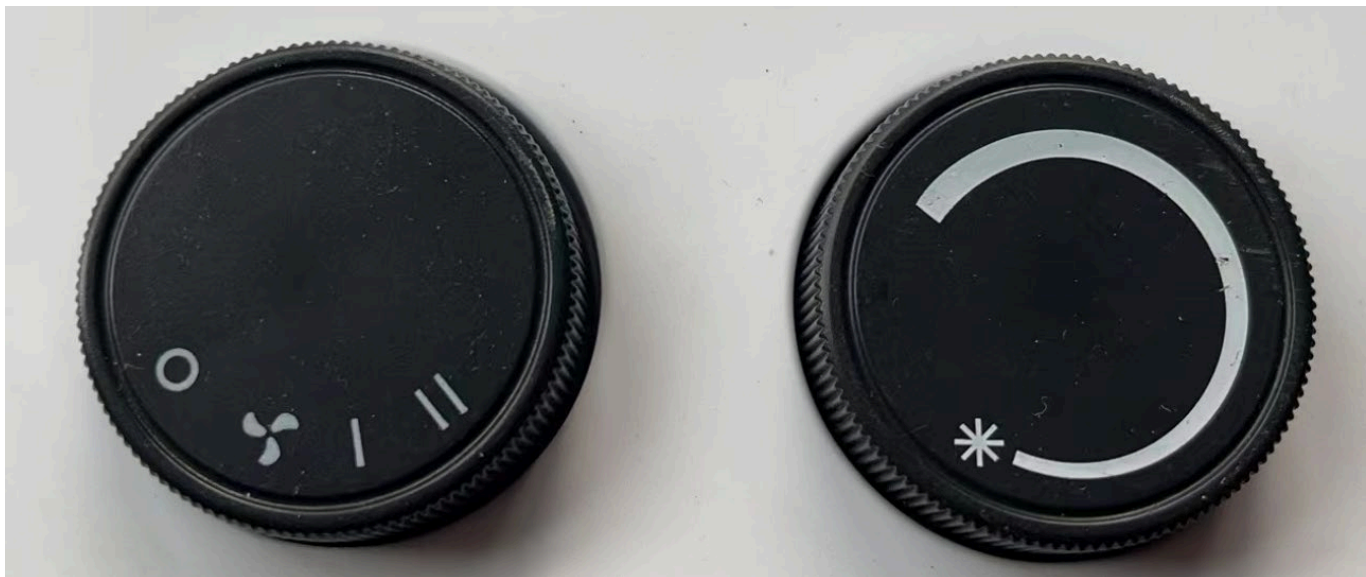
Selector de niveles de potencia