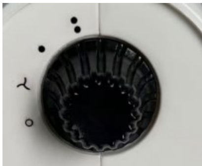
Selector de niveles de potencia