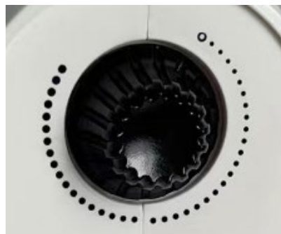
Selector de temperatura (Termostato).